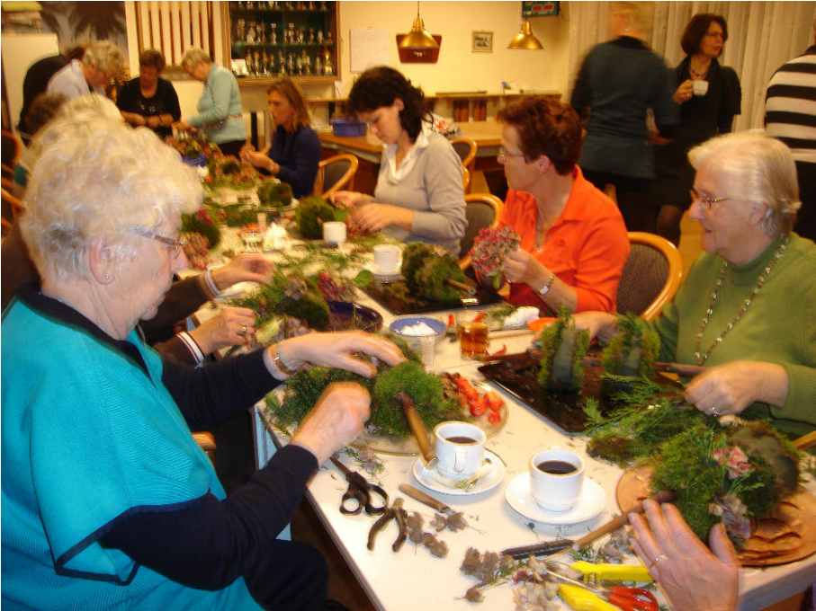
De dames aan het bloemschikken.

Dinsdagavond 10 november hadden we weer een gezellige bloemschikavond. We hebben met een 16 tal dames een mooie creatie gemaakt, jammer dat de straatverlichting het niet deed, het was aardedonker. Dit is gelukkig opgelost en de lantaarnpalen branden weer.