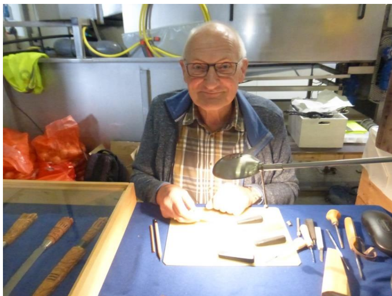
Bij dit verhaal foto's van de maker en zijn maakfels