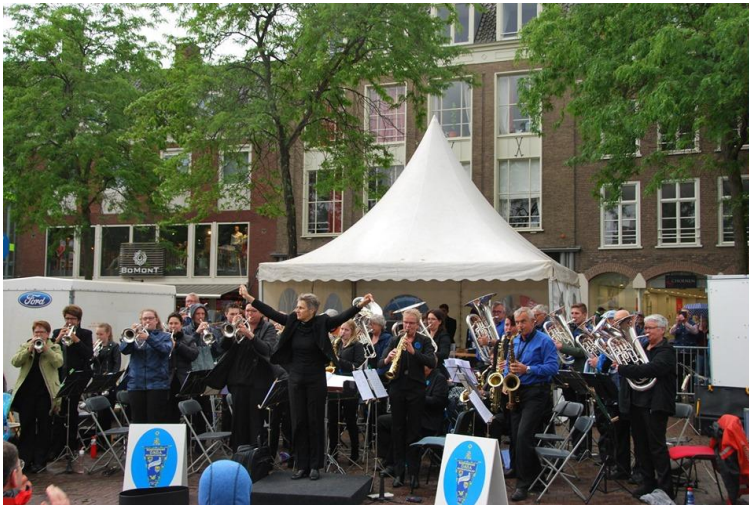
O.N.D.A. geeft een concert tijdens de Veteranen dag op de Markt in Middelburg.